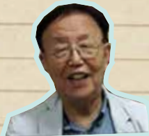
洪潤基 (ホン・ユンギ) 教授