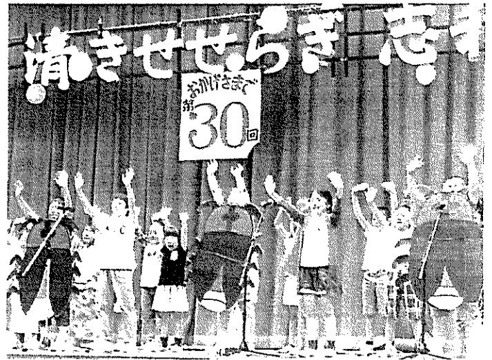
(ホタルまつり 児童発表)

場所: 東広島市立志和堀小学校校庭及び半川付近 事務局(志和堀小): TEL 082-433-2144 FAX 082-420-5621 連絡先(地域センタ-): TEL 082-433-2891 FAX 082-433-2891