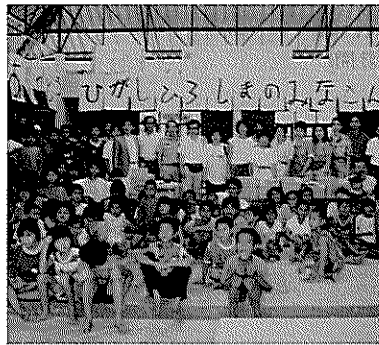
②タイ子ども村学園の図書館落成式