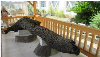
70万年前の埋もれ木