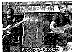
タツゾウ時々カズヒロ