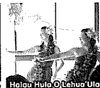
Halau Hula O Lehua'Ula