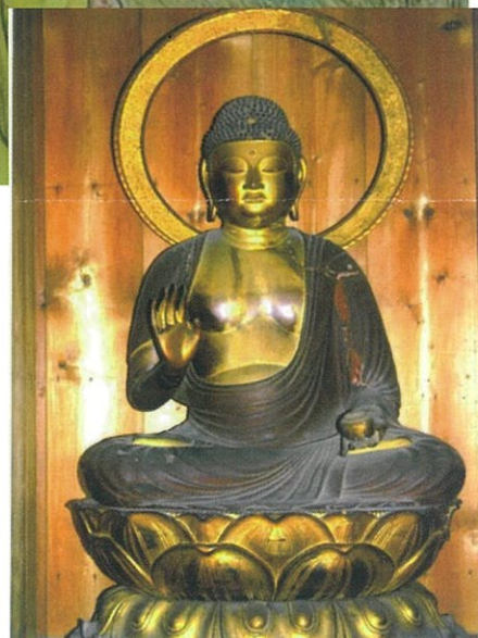
長福寺薬師如来像 (県重文)