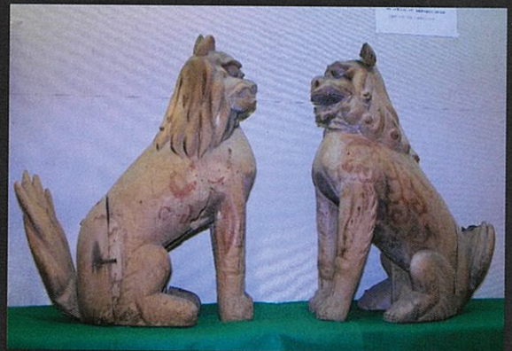
二宮神社の獅子狛犬(市指定文化財)