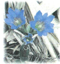
ハルリンドウも見頃

エヒメアヤメは天然自生の 10~15cm の植物で、4月下旬から5月上旬に可憐な花をつけます。近年の山林の荒廃により、エヒメアヤメは激減の一途を辿っています。