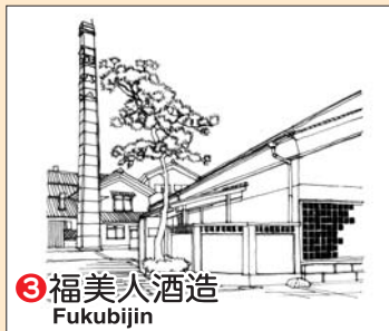
③ 福美人酒造 Fukubijin