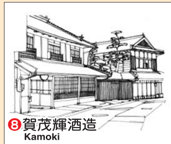
⑧ 賀茂輝酒造 Kamoki

▲ 立身の井戸 TEL (082) 422-2537 ● 円座 TEL (082) 423-8603