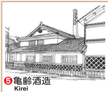
⑤ 亀齢酒造 Kirei

▲ 次郎丸井戸 TEL (082) 423-2118 ● 酒泉館 TEL (082) 423-2021