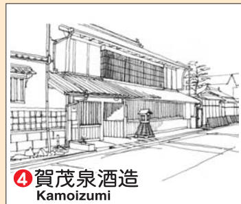
④ 賀茂泉酒造 Kamoizumi

▲ 次郎丸井戸 TEL (082) 423-2118 ● 酒泉館 TEL (082) 423-2021