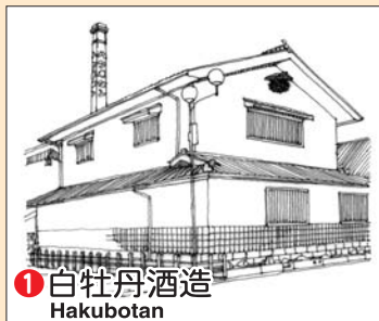
① 白牡丹酒造 Hakubotan

Let's take a walk around "SAKAGURA-dori" street!