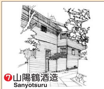
⑦ 山陽鶴酒造 Sanyotsuru