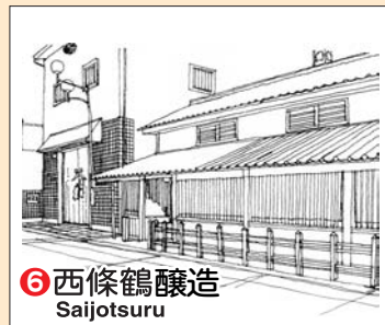
⑥ 西條鶴醸造 Saijotsuru

▲ 万年亀井戸 (まねきいど) TEL (082) 422-2171 ● 万年亀舎 (まねきや)